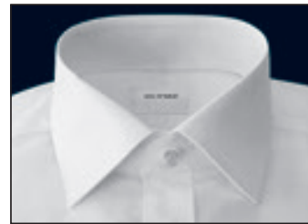
New York Kent New York Kent New York Kent