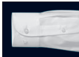
Verstellbare Manschette (zwei Knöpfe zur Weitenregulierung) Adjustable cuff (two buttons to adjust width) Poignet réglables (deux boutons pour régler la taille du poignet)