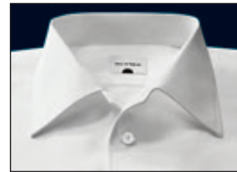
Elbe Elbe Elbe