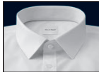
Urban Kent Urban Kent Urban Kent