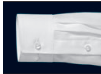
Verstellbare Manschette mit Kombi-Funktion (zwei Knöpfe zur Weitenregulierung, zwei Knopflöcher für Manschettenknöpfe) Adjustable cuff with combi function (two buttons to adjust width, two buttonholes for cuff links) Poignet réglables (deux boutons pour régler la taille du poignet, deux boutonnières pour les boutons de manchette)