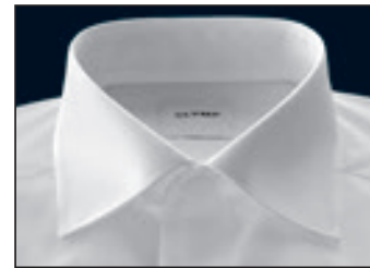
New Kent New Kent Nouveau Kent