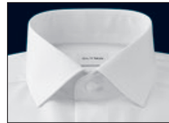
Global Kent Global Kent Global Kent