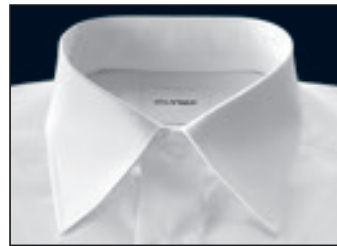
Kent Kent Kent