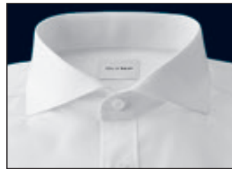
Haifisch Cutaway Italien