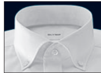
Button-Down Button-down Pointes boutonnées